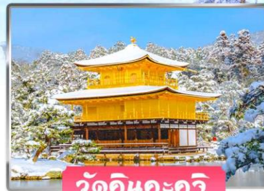
วัดคินคะคุจิ