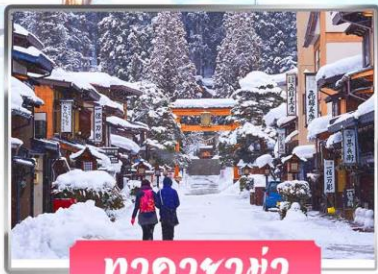
ทาคายามา