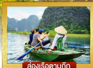
ล่องเรือตามก๊ก