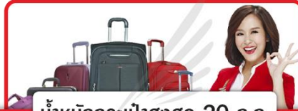
น้ำหนักกระเป๋าสูงสุด 20 ก.ก.