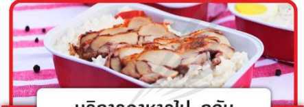
บริการอาหารไป-กลับ